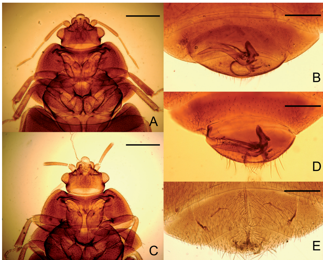
Fig. 2. A. Macho. Cabeza y tórax de O. toledo morfo típico (a). B. Idem. Pigóforo y últimos segmentos abdominales. C. Macho. Cabeza y tórax de O. toledo morfo b. D. Idem. Pigóforo y últimos segmentos abdominales. E. Hembra. Últimos segmentos abdominales. Escalas: A y C 0,5 mm, B, D y E 0,25 mm.

En el morfo b , a pesar de ser por los demás caracteres indiferenciable del otro (Fig. 2 C), el parámetro izquierdo (Fig. 2 D) posee su margen interno levemente curvo, en especial hacia su ápice que es también afilado pero el margen externo es absolutamente recto y el surco medio alcanza igualmente las \frac{3}{4} partes basales de su extensión.