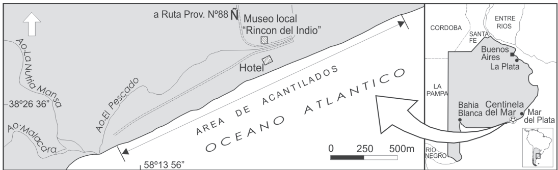
Fig. 1. Ubicación geográfica de la localidad Centinela del Mar

condición derivada para el grupo. Esta apreciación se fundamenta en el hecho de que las especies del género Basilichthys , como así también las especies basales de Odontesthes , son dulceacuícolas. Tanto las especies incluidas en el género Odontesthes como aquellas reunidas en el género Basilichthys constituirían grupos monofiléticos (Dyer, 1997).