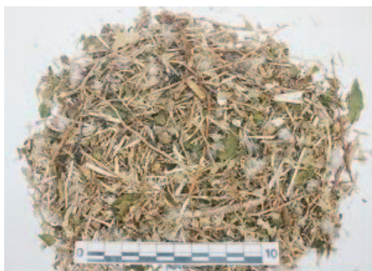
Fig. 3. Uno de los nidos de Myiopsitta monachus monachus en que se practicó el muestreo de parásitos.

obligados y pasan su ciclo de vida sobre el cuerpo del ave (Cicchino & Castro, 1997; Aramburú et al. , 2003). Las camas de material vegetal que las cotorras depositan presumiblemente con fines repelentes (Bucher, 1988) mostraron cinco especies de hábitos parasitarios. Estudios previos (Aram-