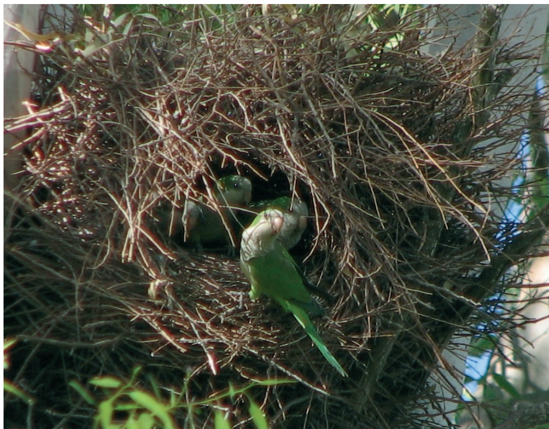
Fig. 2. Ejemplares de Myiopsitta monachus monachus en su hábitat natural.