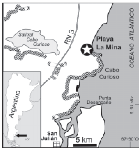
Fig. 1. Mapa de afloramientos de la Formación San Julián (según Panza & Irigoyen, 1994) y localidad de estudio (playa La Mina), en la provincia de Santa Cruz, Argentina.