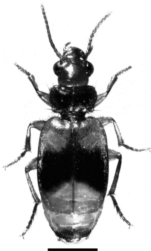
Fig. 1, Somotrichus unifasciatus (Dejean, 1831), hembra. Escala = 1 mm.

Hábitos: clásicamente se ha asociado a diversos productos de importación por vía marítima (Darlington, 1968), soportando incluso largos viajes en productos almacenados (Habu, 1967). Fairmaire (1849) la señala en el puerto de Marsella (Francia) en semillas de lino, más tarde Houlbert (1921) la encuentra, en el mismo puerto, desembarcada conjuntamente con un cargamento de maní ( Arachis hypogea ), y Freude (1976) en el puerto de Hamburgo (Alemania) con orquídeas traídas desde Bolivia, aunque no se pudo precisar que S. unifasciatus proviniera precisamente de ese país. Además ha sido citado en guano en costa de Marfil, huesos para molinera en Inglaterra (Walker, 1916; Hinton, 1945), y en los cimientos de un molino harinero (Hinton, 1945).