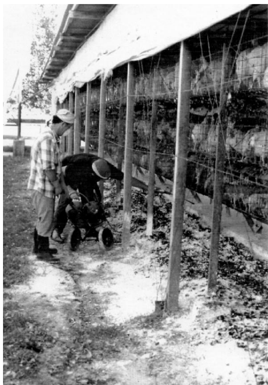
Fig. 7: Vista panorámica de la formación de guano y su encalado en un criadero de de pollos de la zona de Capilla del Señor, partido de Exaltación de la Cruz, Provincia de Buenos Aires (marzo de 1997) (foto E. Saini).