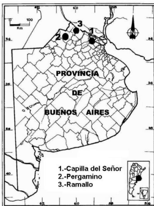
Fig. 8: Distribución conocida de Somotrichus unifasciatus (Dejean, 1831) a enero de 2003 en la provincia de Buenos Aires, Argentina.