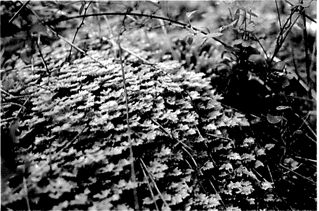
Fig. 8. Hypopterygium didactyon Müll. Hal.