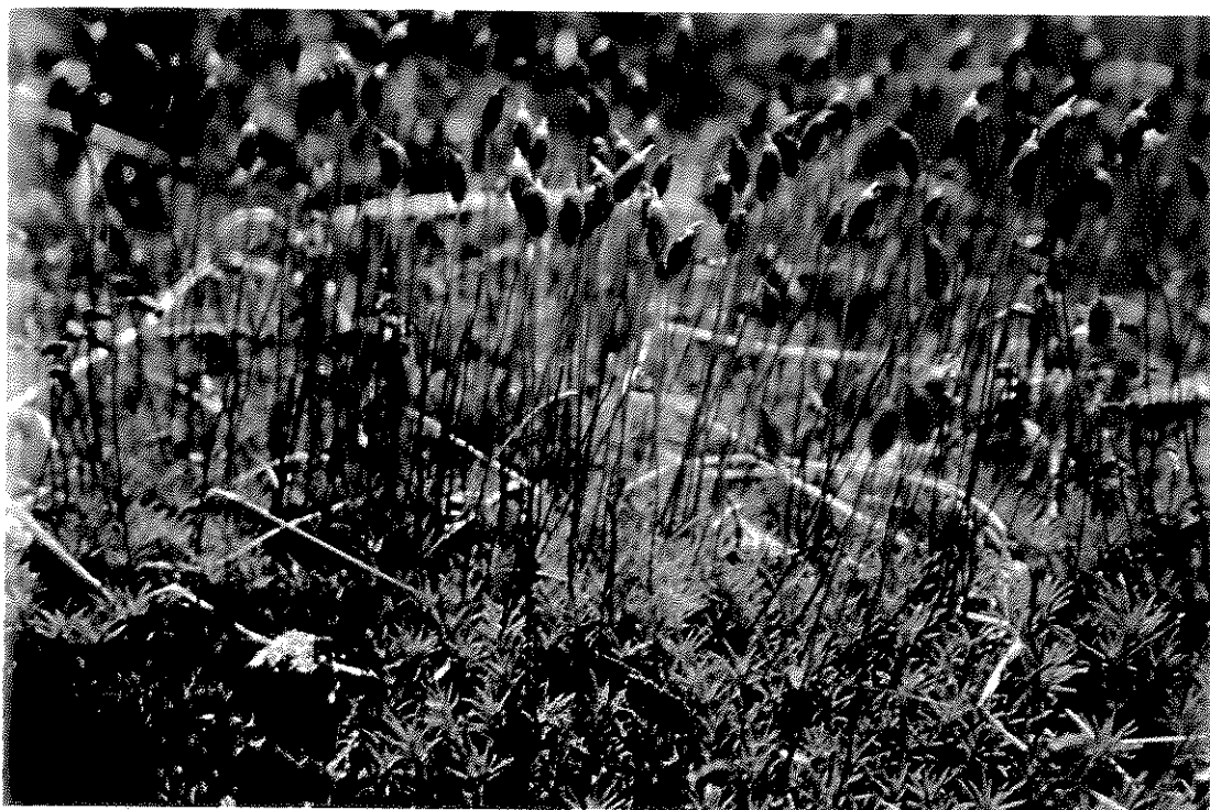
Fig. 9. Polytrichastrum longisetum (Hook. f. & Wilson) G. L. Sm.