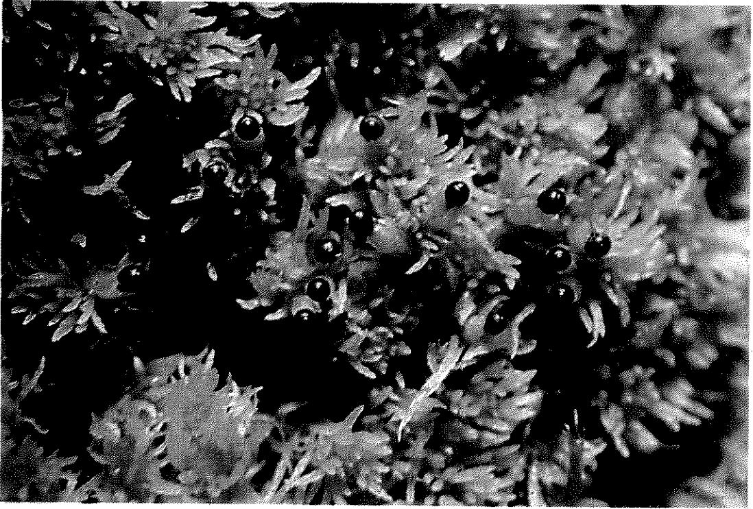
Fig. 4. Sphagnum fimbriatum Wilson