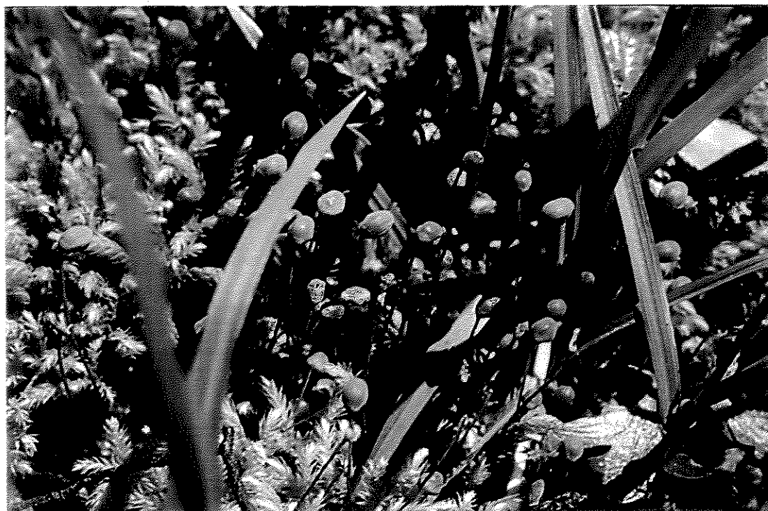
Fig. 2. Philonotis vagans (Hook. f. & Wilson) Mitt.