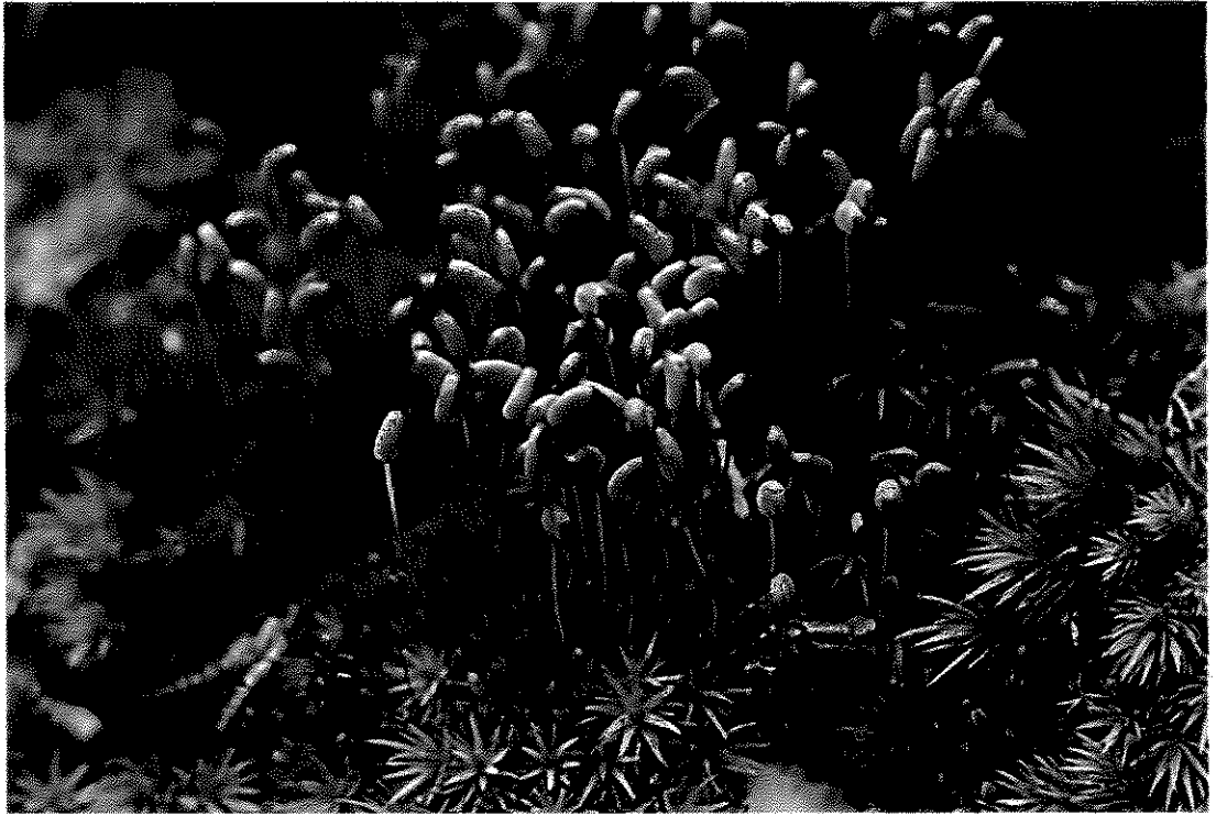
Fig. 11. Notoligotrichum trichodon (Hook. & Wilson) G. L. Sm.