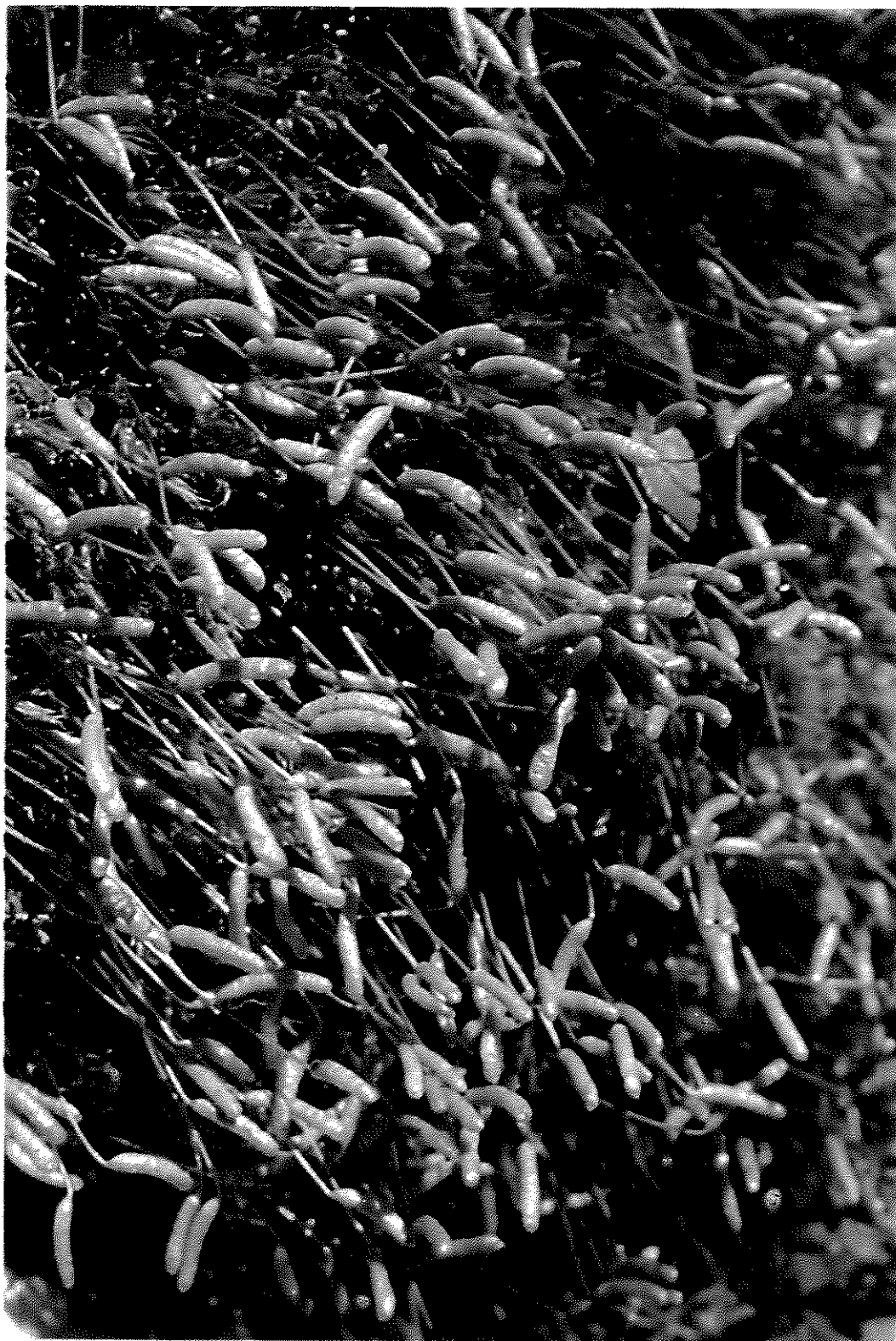
Fig. 6. Leptostomum menziesii R. Br. bis.