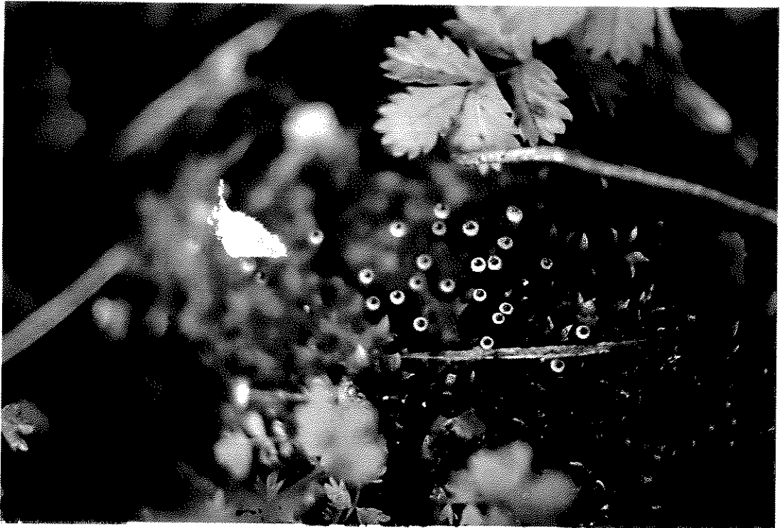
Fig. 5. Tayloria mirabilis (Cardot) Broth.

C. Du Ej C. Du Ej *C Ej C. Ej Di C. pe Ej (E *( Ej *( Ej C Ej *( pe Ej F # Ej C Ej Ej C n f Ej C I C I C I