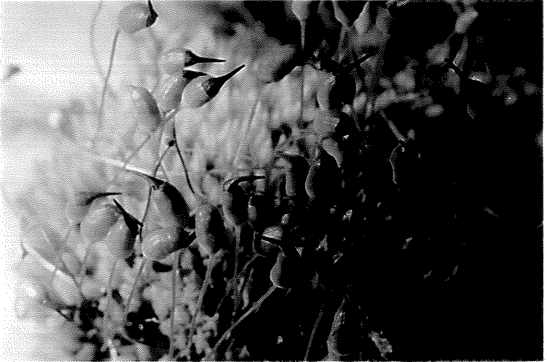
Fig. 7. Conostomum pentastichum (Brid.) Lindb.