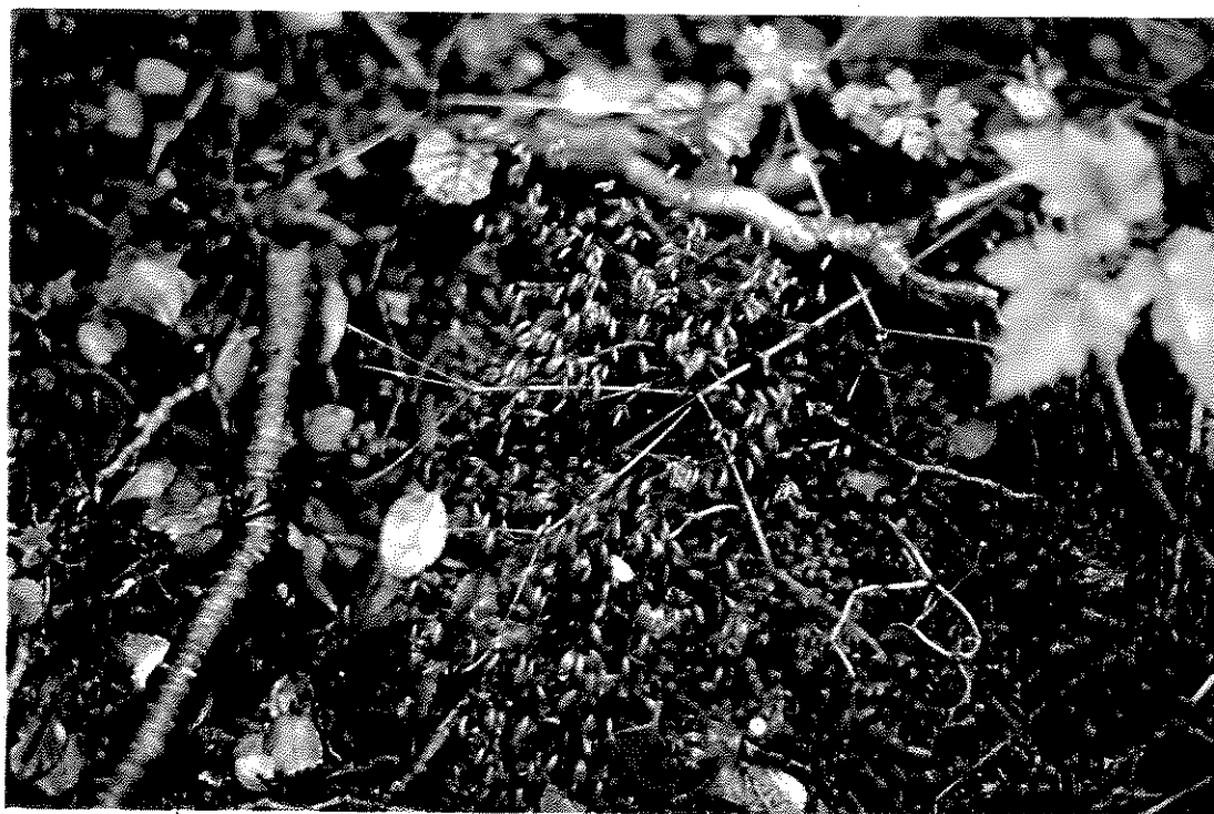
Fig. 10. Goniobryum subbasilare (Hook.) Lindb.