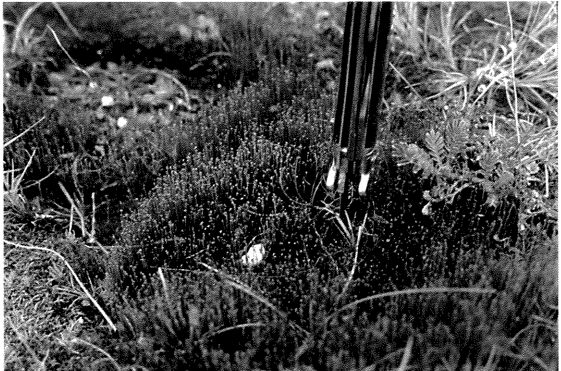
Fig. 12. Skottsbergia paradoxa Cardot.