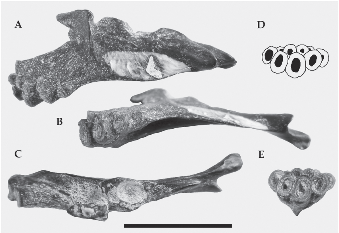
Fig. 2. Trichomycterinae indet. (PVL 2311), opérculo derecho en vistas: A, lateral; B, ventral; C, dorsal. D-E: detalle de las bases para los odontoides constituyendo un parche en el proceso posterior. Escala 10 mm.

primaevus (MLP 21-871), un Trichomycteridae del Eoceno de la localidad de Las Bayas, provincia de Río Negro, Argentina. Dicho registro indujo a Ringuelet (1975) a considerar un genocentro Patagónico para esta familia de Siluriformes. Sin embargo, una revisión más reciente de Cione & Torno (1988) ha indicado que P. primaevus debe ser excluido de los Siluriformes y puede ser ubicado dentro del orden Perciformes, posiblemente dentro de la familia Percichthyidae. De este modo, los materiales aquí comunicados constituyen el primer registro fósil para la familia Trichomycteridae .